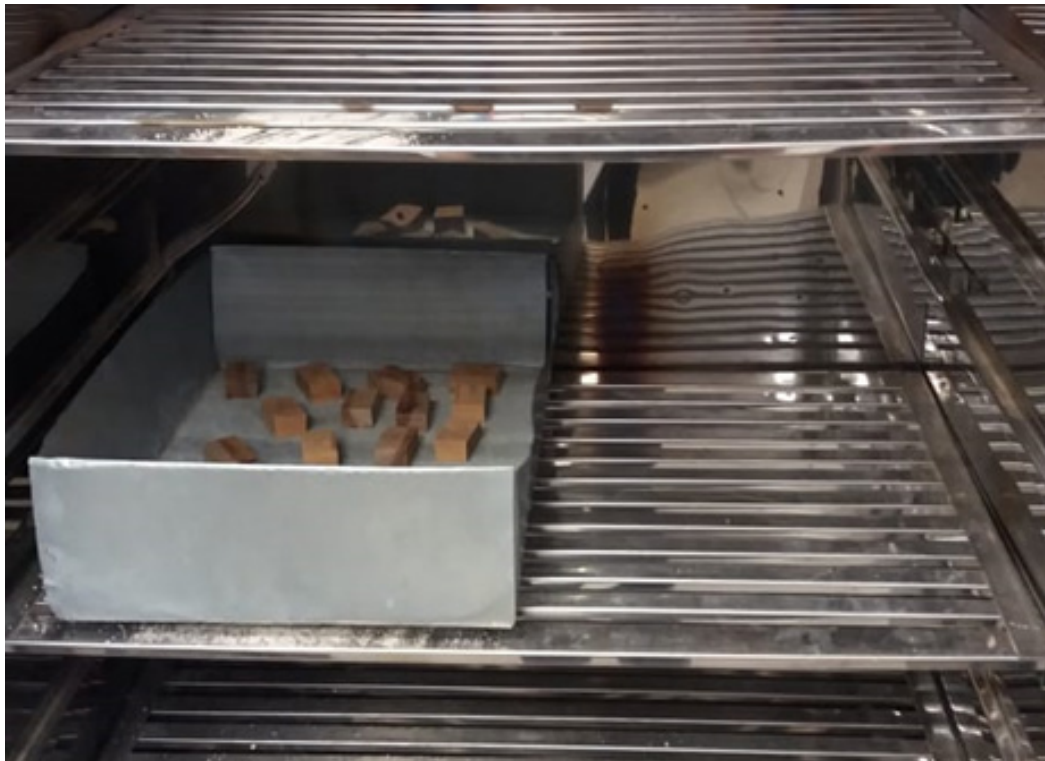
Figura 3 - Amostras utilizadas para experimento em laboratório.