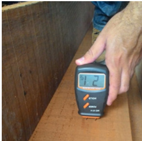
Figura 2 – Medição in loco utilizando o MD-814.

Durante a secagem, determinada a cada 6h até que ocorresse uma variação entre duas medidas consecutivas, menor ou igual a 0,5% da última massa medida, considera-se então, essa massa seca. Durante a secagem, a massa dos corpos de prova foram novamente medidas até que não ocorresse mais variação da massa.