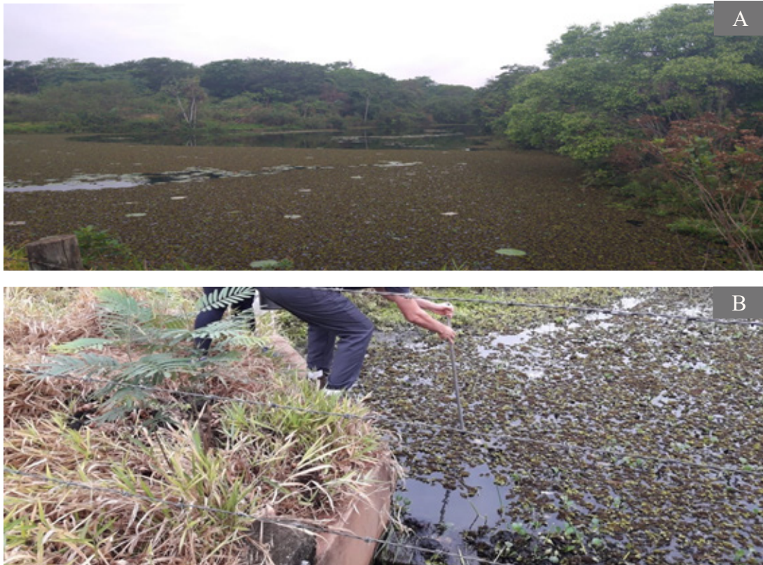
Figura 4 - Panorama geral (A) e coleta (B) do ponto P3.

da vegetação ciliar, no ano de 2011 foi implantado um Sistema Agroflorestal ao longo dos reservatórios (OLIVEIRA NETO et. al., 2014). A vegetação confronta o maciço florestal de um dos fragmentos da reserva (Figura 4).