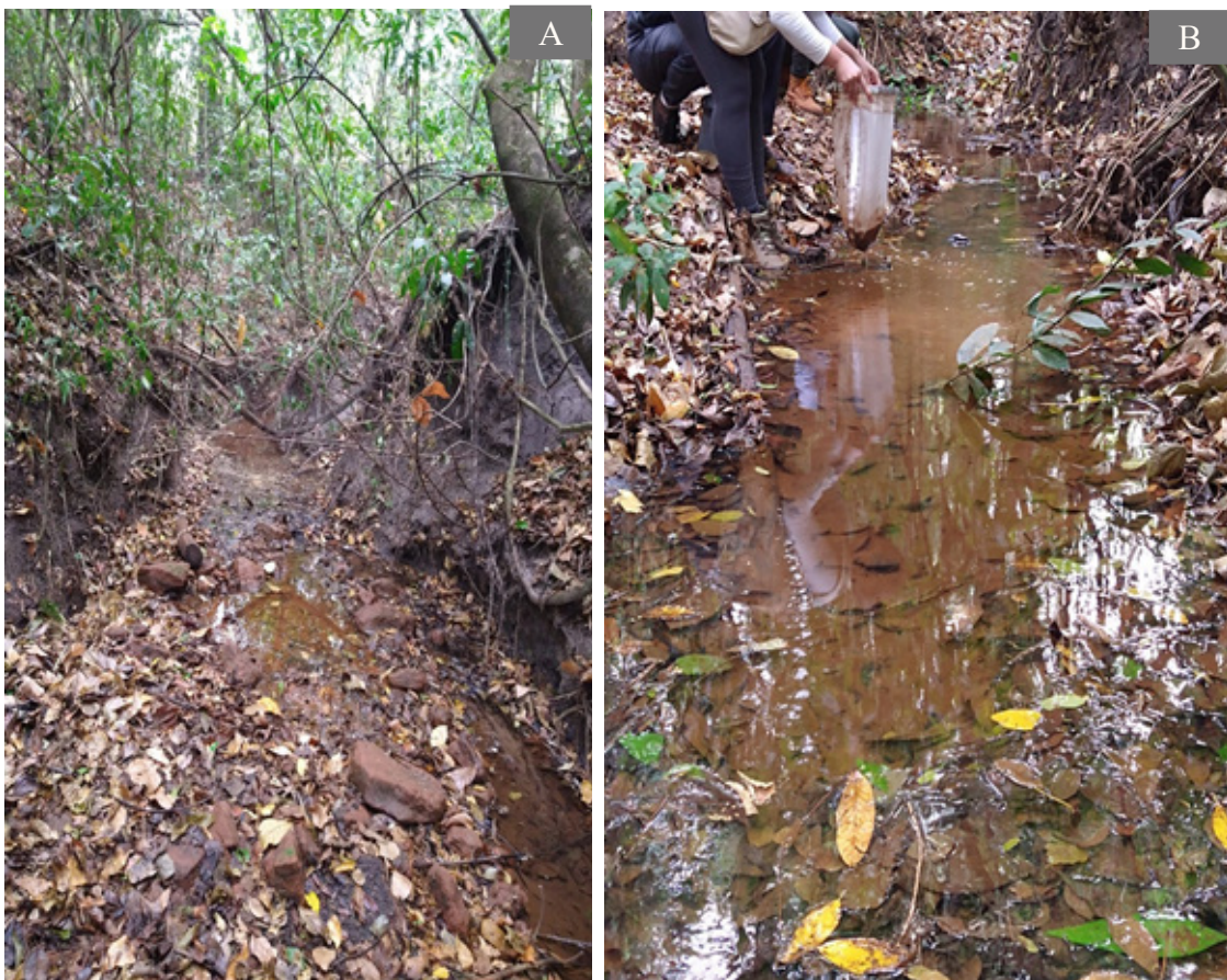
Figura 2 - Panorama geral (A) e coleta (B) do ponto P1.

O primeiro ponto amostrado (P1) inserido no FI recebe a contribuição de duas nascentes que afloram no interior do fragmento e alimentam o açude principal (LOPES, 2011) (Figura 2).