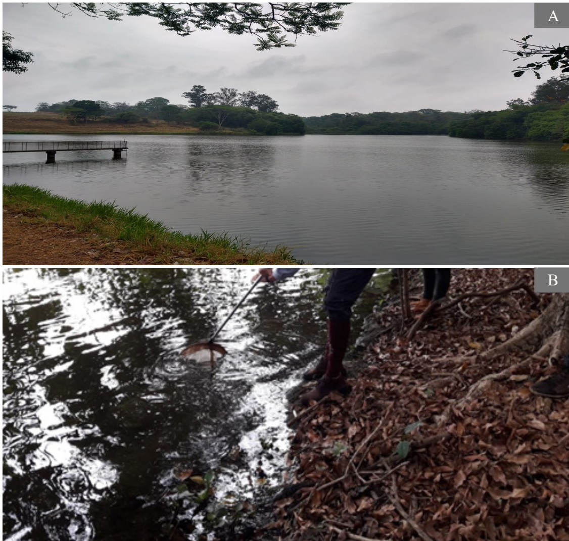
Figura 3 - Panorama geral (A) e coleta (B) no ponto P2.