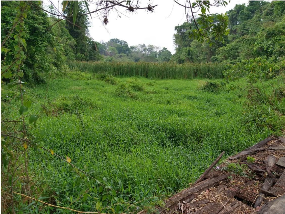
Figura 5 - Panorama geral do ponto P4.